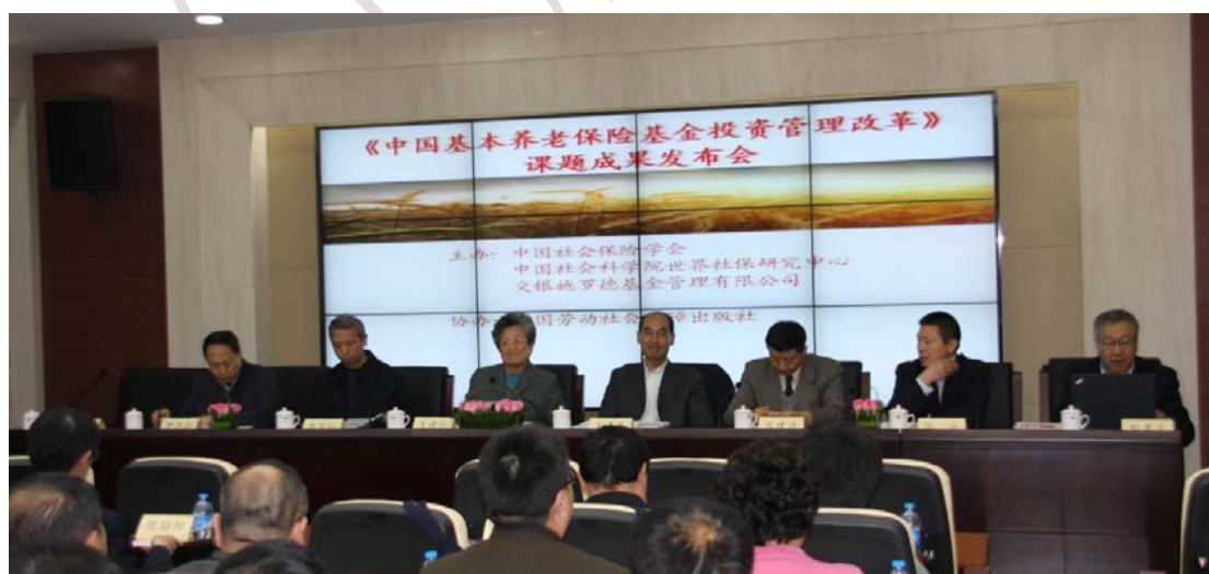
图 1: 《中国基本养老保险基金投资管理改革》课题成果发布会开幕式

2014 年 11 月 14 日, 中国社科院世界社保研究中心与交银施罗德基金管理有限公司和中国社会保险学会在北京举办科研成果发布会, 联合推出《中国基本养老保险基金投资管理改革》一书。该书对中国基本养老保险基金投资管理改革进行了全面性、系统性和前瞻性的研究, 从我国基本养老保险基金的属性、发展历史和现状出发, 借鉴养老保险基金投资的国际经验, 通过理论和实践相结合, 分析比较养老金投资运营的各种可行模式, 对投资运营政策、监管提出了诸多有益的建议, 对基本养老保险基金投资运营体系的设计提供了改革思路。来自人力资源和社会保障部 ( 包括地方社保经办机构 )、全国社会保障基金理事会等机构的 100 多位领导和学者出席了本次发布会。