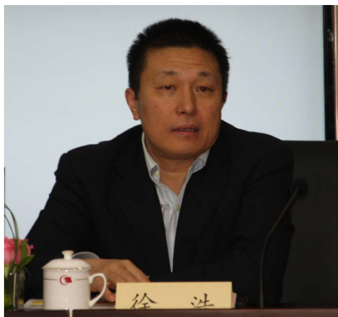
图 7：中国证监会证券基金机构监管部副主任徐浩致辞

对基本养老保险基金投资管理的行政法规；二是基金管理结构市场化，投资策略多元化，减少行政干预；三是改革投资理念和投资策略，通过多元化市场配置有效平衡基金安全和收益。