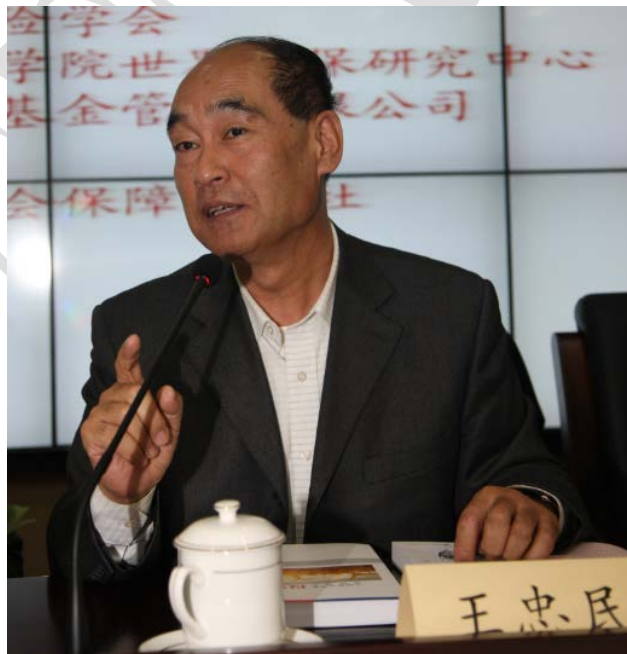
图 4：全国社会保障基金理事会副理事长王忠民致辞

王忠民副理事长首先阐述了全国社会保障基金理事会在个人账户做实试点和广东省社保基金委托投资中发挥的作用；随后提出不仅养老基金、还包括医疗基金、住房公积金和住房维修基金都存在着管理问题，总的原则就是市场化管理方式；最后指出该书的出版不仅对一些疑问给出了答案，而且也起到警醒、呼唤和引导全社会对这一问题给予高度关注，意义重大。