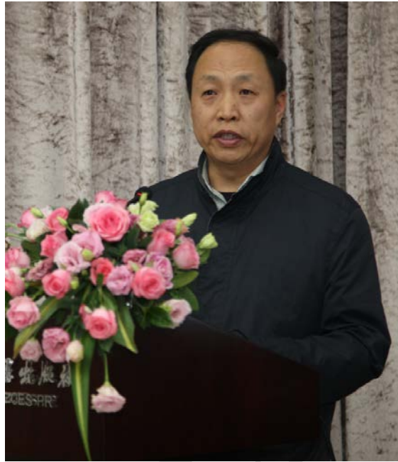
图 5：人力资源和社会保障部养老保险司副司长尹志远致辞

合并城乡基本养老保险、制定职工和居民两大制度平台转移接续办法、完善省级统筹并向全国统筹过渡、制定养老金调待机制、完善个人账户、制定延迟退休政策和完善职业年金计划。