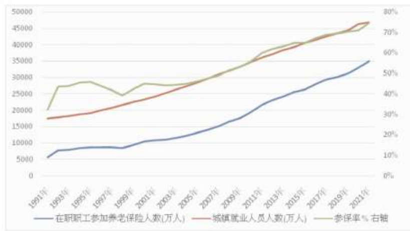
图1 1991—2021年城镇就业和养老保险覆盖面变化

快速兴起,平台经济、零工经济下的新形态就业人员参保问题越来越突出。2021年,国务院发布《关于维护新就业形态劳动者劳动保障权益的指导意见》,提出“放开灵活就业人员在就业地参加基本养老、基本医疗保险的户籍限制”;为促进社保制度的全覆盖,十四五规划提出“全面实施全民参保计划,实现基本养老保险法定人群全覆盖”的目标。图1反映了1991—2021年的30年期间,城镇就业人口总量和基本养老保险在职参保职工人数的变化趋势。在此期间,参保人口与就业人口基本保持同步增长,就业总量由1991年的1.75亿增加到2021年的4.67亿,年均增速为3.32%;在职参保人口总量则由5600万增加至3.49亿,年均增速为6.28%。