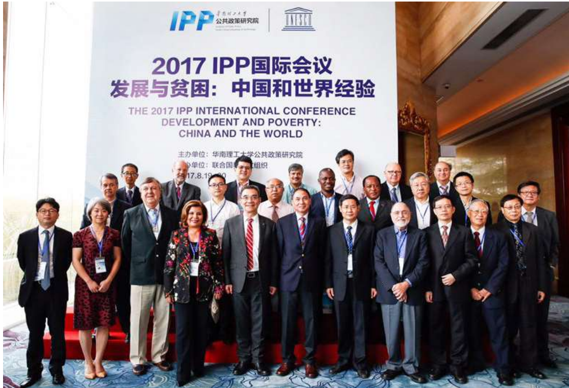
与会专家学者合影