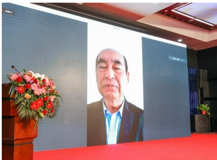
全国社保基金理事会前副理事长王忠民先生发表演讲

ESG 投资将在我国健全多层次养老保险发挥重要作用。人口老龄化和气候变化是全球面临的问题，必须高度关注，从长计议，我国要未雨绸缪，企业要增强社会责任。我国三类养老金已达 13 万亿，投资应摒弃简单的分散投资理念，进入 ESG 领域，能够找到更多好的投资机会，增强保值增值，提高应对人口老龄化能力。截至 2020 年末，全球 ESG 资产规模已达 35 万亿美元，养老基金作为资本市场重要参与者，在践行 ESG 理念上将发挥重要作用。