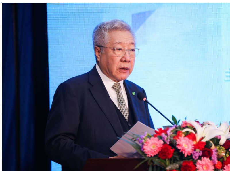
中国社科院世界社保研究中心主任郑秉文教授

中国银保监会保险资金运用监管部主任袁序成先生指出，ESG 投资的资产对环境和社会产生影响，与新发展理念十分契合，深化长期资金 ESG 投资理念有助于高质量发展。保险资金 ESG 投资的力度加大，方式多元，保险资金投入相关产业初步统计达到上万亿。目前保险资金 ESG 投资在评价标准和评价标准、数据标准、数据标准等仍面临不足，符合 ESG 投资的金融产品种类仍有限，自身能力建设还存在短板，机构需要对公司治理、投资运作、风险管理、信息披露等方面进行改造，在专业人员储备上做好准备。