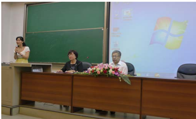
图2: 郑秉文在四川大学公共管理学院讲座

2013年7月3日,四川大学公共管理学院在望江干部培训基地2号演播厅成功举办了社会保障专题讲座。我院特邀了中国社科院世界社会保障中心主任郑秉文教授作为